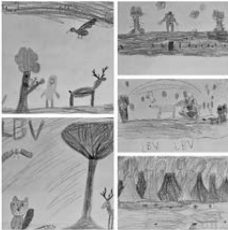
Kunstwerke von Schülerinnen und Schülern der 1. Klassen

der Sammelwoche. Sie betonen die Wichtigkeit, sich für den Schutz von Vögeln und der Natur einzusetzen und sind dankbar für die Unterstützung der Eltern und der gesamten Schulgemeinschaft.